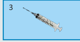
सिरिज (१० मिली) २