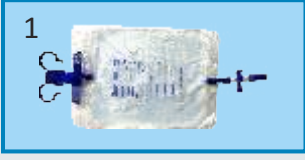
ब्लड कलेक्शन बॅग