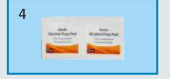
अल्कोहोल स्वॅब्स २