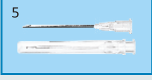
१६ गेज निडल्स २