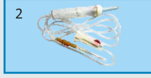
इड सेट (फिल्टरसह) २